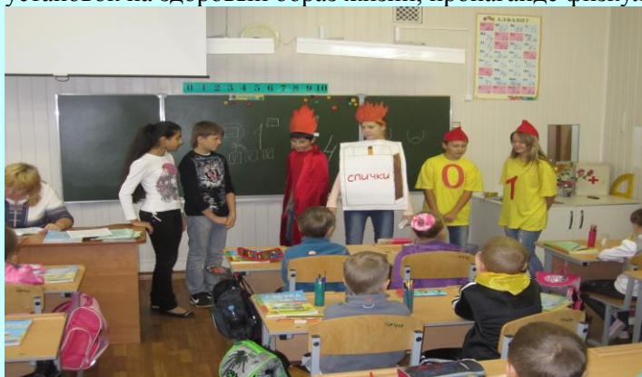
«Дружина юных пожарных»

В октябре в нашей школе проводился месячник «Взгляд в будущее». Его целью стали пропаганда здорового образа жизни, формирование у обучающихся антинаркотических установок и личной ответственности за свое поведение. Особое внимание уделялось диагностической и индивидуальной работе со всеми участниками образовательного процесса, вопросам взаимодействия со службами системы профилактики, формированию установок на здоровый образ жизни, пропаганде физкультуры и спорта.